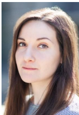
Перлін Дадашова FRM, Директор департаменту фінансової стабільності НБУ