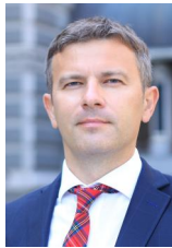
Сергій Ніколайчук Заступник Голови НБУ